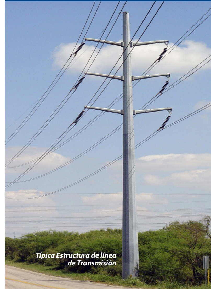
Típica Estructura de línea de Transmisión